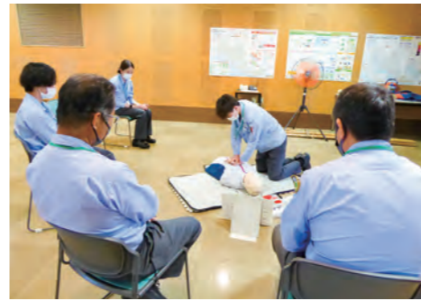
●三菱マテリアル株式会社 明石製作所(令和五年五月九日(火))の訓練風景 ●コベルコ建機株式会社 大久保事業所(令和五年四月二十日(木))の訓練風景