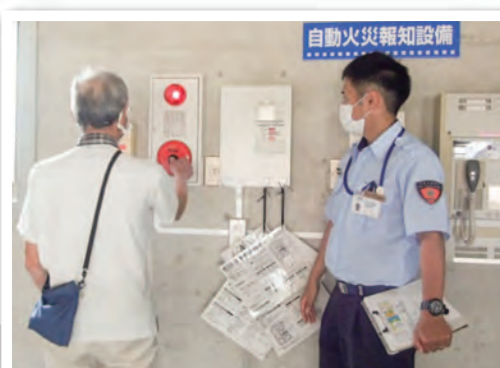
●警報設備訓練風景